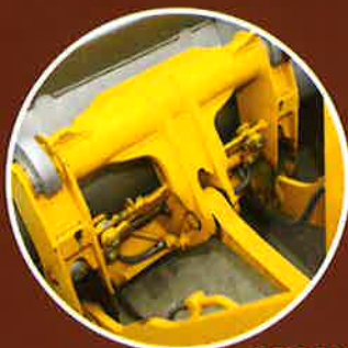
油圧式マルチカプラ (オプション) アタッチメントの脱着が容易です。