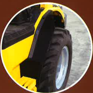
リヤーフェンダ ステップ、運転席への糞尿付着を防止します。