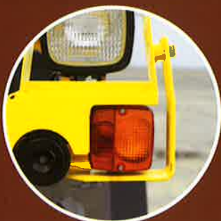
ウインカーガード ウインカーの破損を防止します。