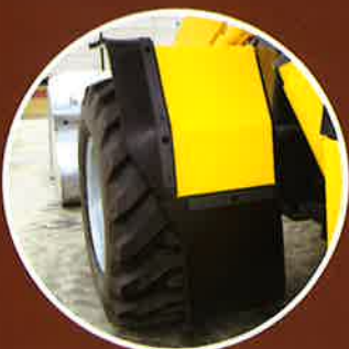
フロントワイドフェンダ 糞尿の巻き上げを防止します。