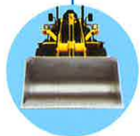
亜鉛メッキ畜産バケット/リム 錆による腐食を防止します。